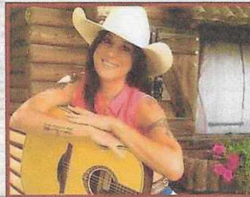
ALLY JOYCE COUNTRY BAND (I)