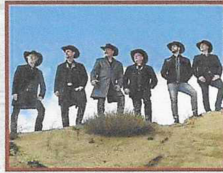
TRUCK STOP (D)