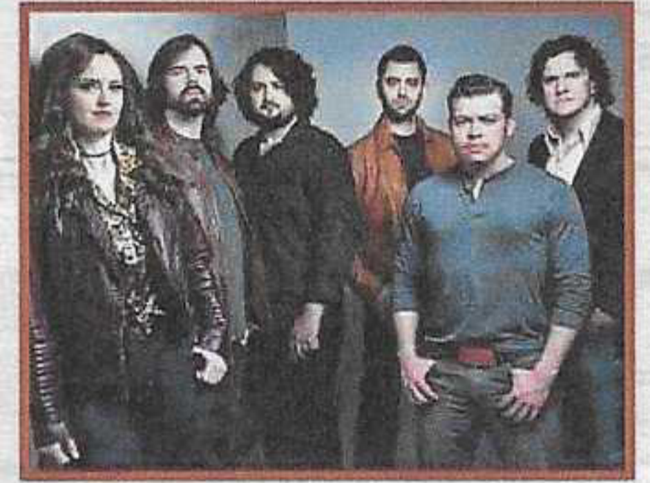
EAST NASH GRASS (USA)